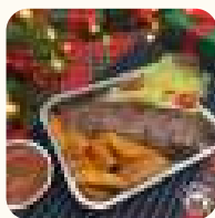
皇牌燒牛柳 配薯角(約18安士) 白酒忌廉煮藍青口(2磅裝) HK$488 $158