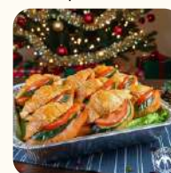
煙三文魚蕃茄青瓜牛角包(10件) $178