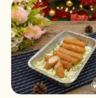
香酥黃金蝦手指(12件) $158