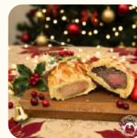
迷你威靈頓拼盤: 三文魚,牛扒(各1件) $188