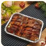
狂野BBQ醬燒豬仔骨(12件) $168