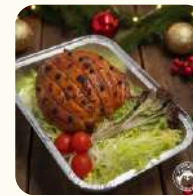
蜜糖烤煙熏金門火腿(約2磅) $318