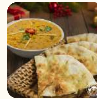
乳酪咖哩配牛肋條 配手抓餅(12小件) HK$178