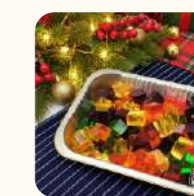
彩虹4色啫喱糖(2磅裝) $98

✦到會滿$1,500 免費送貨 (地面交收) 如果訂單未滿$1500會收取地區運費👩🏻👨🏻