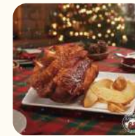
德國咸豬手(1隻切件) $168