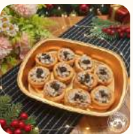
黑松露野菌酥皮盒(10件) 意大利巴馬火腿哈蜜瓜卷(12件) HK$138 $158