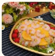
芒果大蝦雜果薯仔沙律(2磅裝) $178