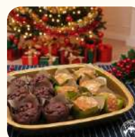
Mini雙色鬆餅: 朱古力,蘋果玉桂(12件) $158