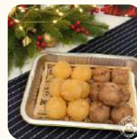
迷你朱古力+ 雲呢拿忌廉泡芙(16件) $118